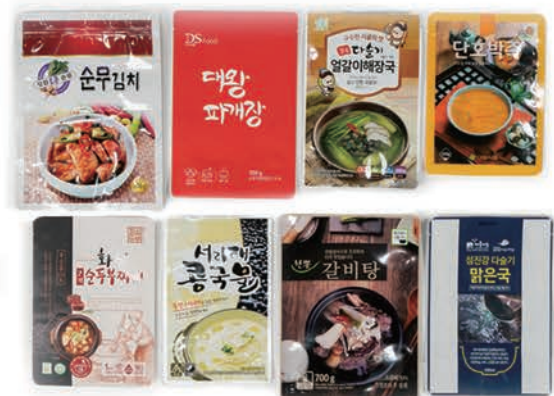
스텐딩 삼방 파우치