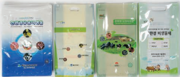
스텐딩 엔방 파우치 (2L ~ 5L용)