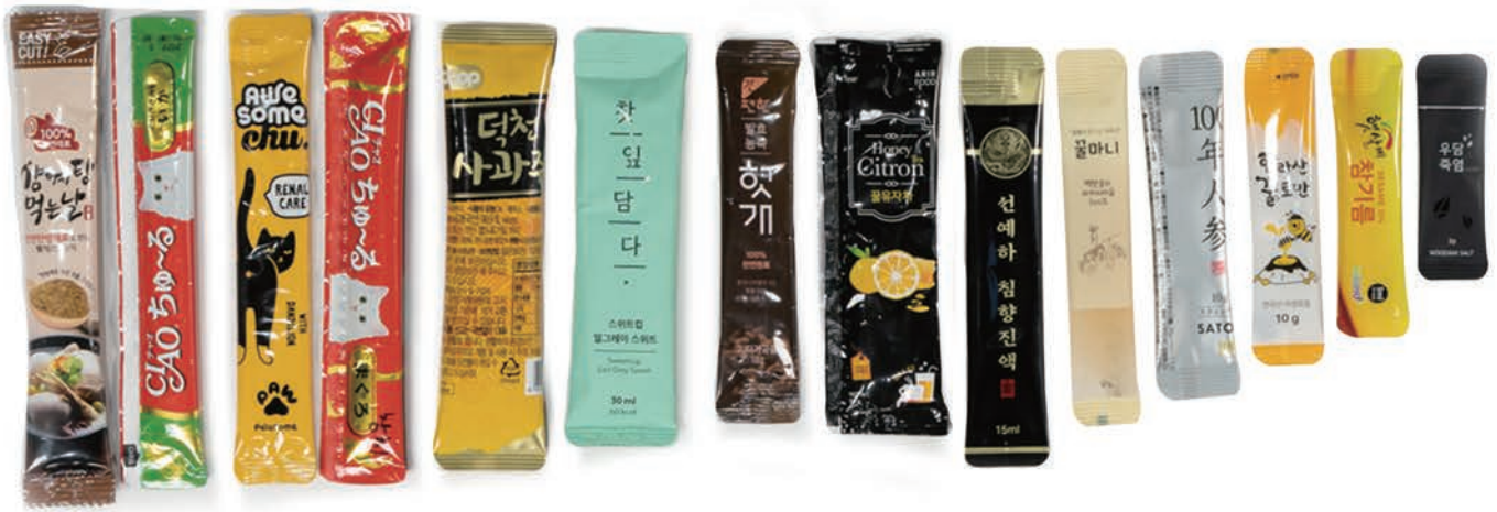
스틱, 액상, 분말